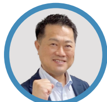
鎌 船 敦 TIMC OSAKA Manager