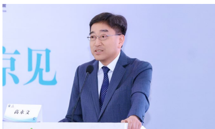
全国政协常委、香港特别行政区前食 物卫生局局长、大湾区医疗专业发展 协会荣誉会长——高永文