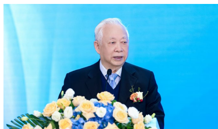
原国家卫生部副部长、 中华医学会常务副会长、中国 抗衰老促进会顾问——曹泽毅

各国旅游局、卫生健康部门 National Tourism Bureaus, Health Department.