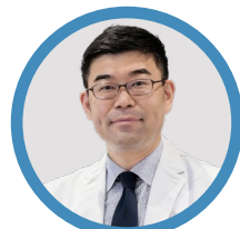
小川 誠司 日本小川优生医学中 (Tokyo ART Clinic) 院长、 日本藤田医科大学生殖中心、 主任医生, 教授