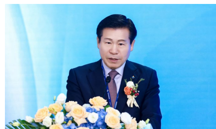
韩国大邱广域市中区政府 区长——柳圭夏