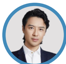
汪 相 伯