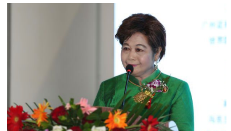
泰国卫生部外事局局长 泰国皇室亲王蒙拉查翁· 沃拉芭帕·扎伽潘