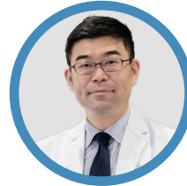
小川 誠司 日本小川优生医学中 (Tokyo ART Clinic) 院长、 日本藤田医科大学生殖中心、 主任医生, 教授