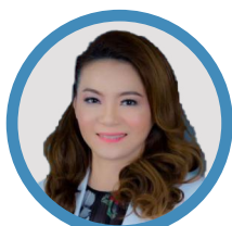
苏 查 妲 · 梦 琨 蔡 帕